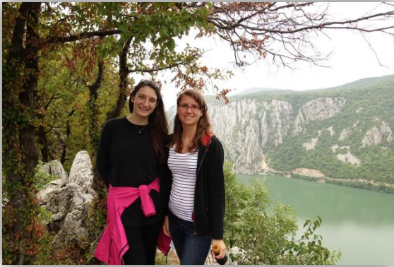
A Kazán-szoros tetején