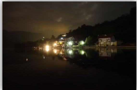
Duna az éj sötétjében