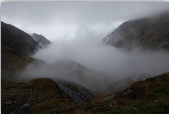
Felhők felett a Fogarasban