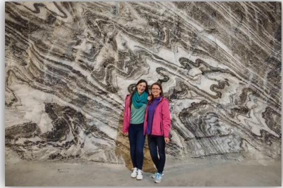
Ocnele Mari sóbánya